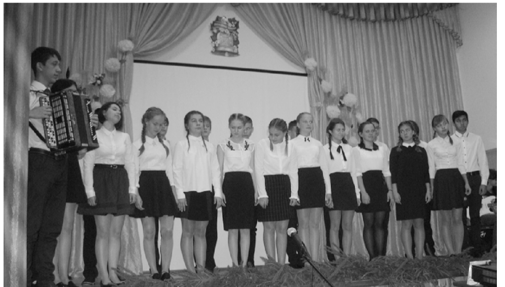
Празднование исторических дат направлено на воспитание у учащихся бережного отношения к тому, что было создано поколениями, жившими до нас и для нас, уважения к старшему поколению. Наш долг

Сейчас как никогда нужно сосредотачиваться на патриотизме, толерантности, терпимости, задавая вопрос: «А готовы ли нынешние молодые люди принять эстафету предыдущих поколений, отстаивать будущее, честь и достоинство России? Не допустить повторения трагедии?».